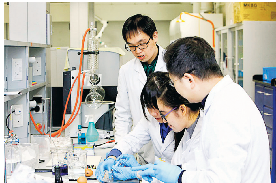
▲人才培訓和提升專業水平都是檢測及認證業非常重視的範疇