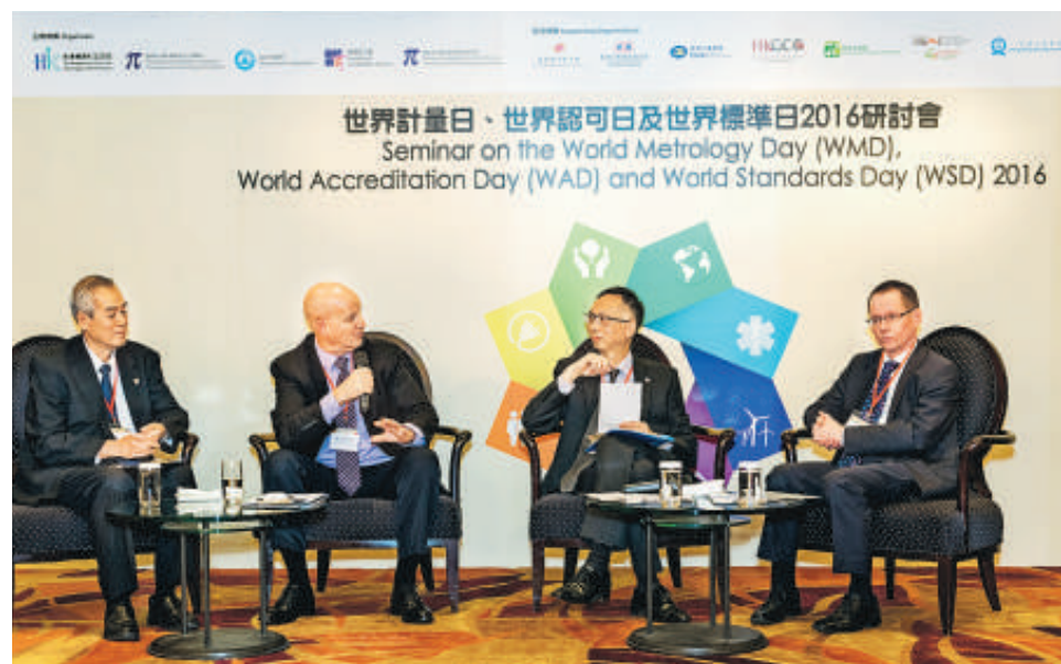
▲多位專家在研討會上分享交流，內容豐富。

認同的標準不但能加強信心，並且可增加溝通的可靠程度，將信息有效地向各界傳遞。此外，若產品的品質及安全性都能夠符合國際標準，將有利於通向國際市場，獲取廣大消費者的信心。IEC 關注電力、電器及電訊產品的安全，是由於它們對大眾的日常生活影響重大，IEC 會長野村淳二博士表示：「信任建立在可靠的標準之上，當市場上的產品能符合國際標準，消費者的信心亦會大增。因此我們與各相關機構包括國際標準化組織（ISO）及國際電訊聯盟（ITU）合作，為各類型電子電器產品制定安全和品質標準。我們一直與這些機構緊密合作，並每年定期檢討有關標準和提出新發展計劃，以期可有效保障消費者的安全。」