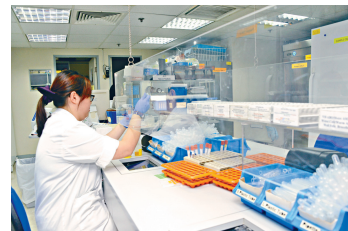
■「實驗所認可計劃」要求化驗所提供安全環境及設施予員工作業