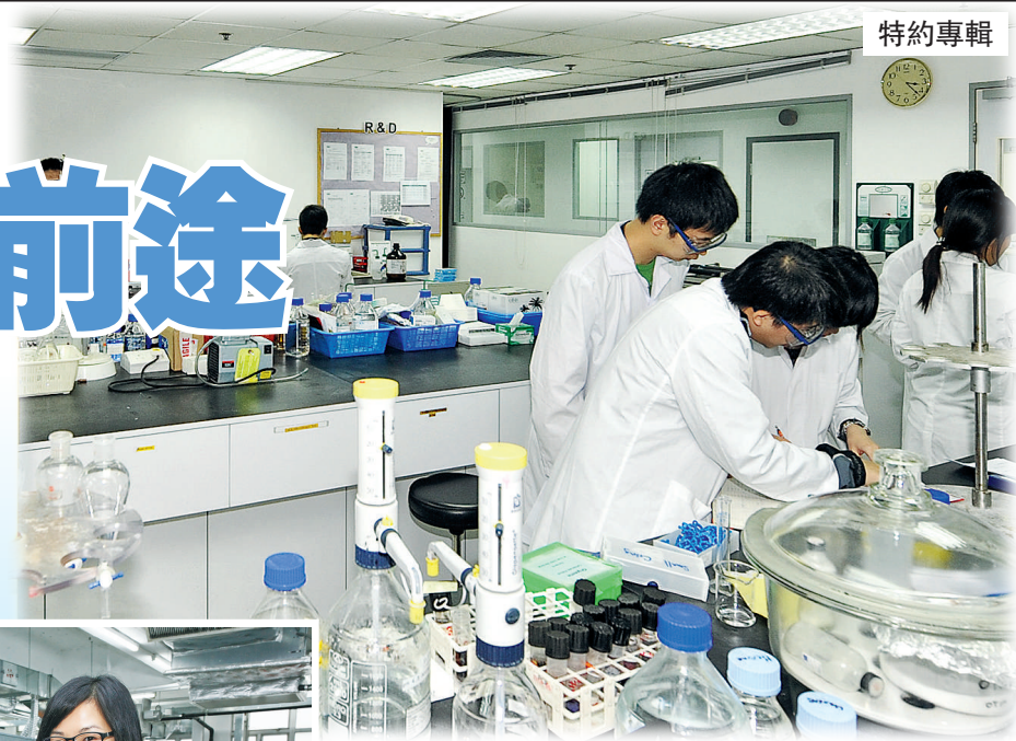
▲檢測及認證業行業培訓諮詢委員會推出「過往資歷認可」機制，為從業員提供測試考核，以確立專業水平。