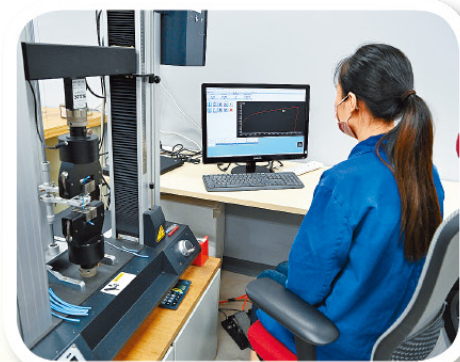
▲檢測認證從業員透過產品檢測保障大眾安全，工作別具意義。

除產品測試外，每當有新產品及技術推出市面時，UL的標準部門協同檢測認證從業員亦會參與訂立相關的安全標準，保障消費者安全。陳經理說：「記得電動滑板最初於美國面世時，頗生意外。我們的首席工程師遂進行研究及資料搜集，並與各界及持份者諮詢和商討，於短短三個月內協助美國消費安全委員會訂立一系列的安全標準，讓消費者安心使用相關產品。」