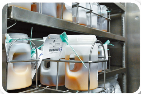
▲每逢賽事，從業員需檢驗過百馬匹尿液樣本，確保出賽馬匹體內不含違禁物質。

香港賽馬會賽事化驗所的檢測從業員會為在賽前、賽後及受訓期間收集的馬匹血液、尿液和毛髮樣本以及騎師的賽後尿液樣本進行各項檢測，確保馬匹和騎師體內不含違禁物質。賽事化驗所主管暨首席賽事化驗師何毅雯博士表示：「每場賽事牽涉多達150隻馬匹。檢測人員需要在開賽前短短幾小時內完成過百個樣本的測試，確保賽事在零禁藥的環境下公平公正地舉行。」